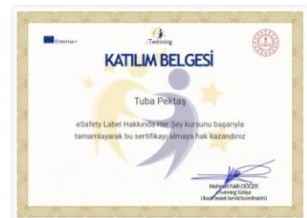
Certificates - Everything about eSafety Label of the teachers and the headmaster