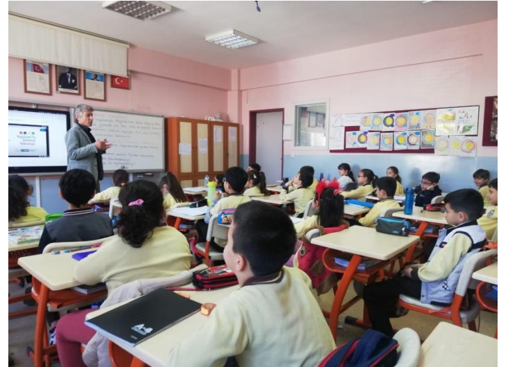
Counseling course with the students about safe internet- privacy of personal information