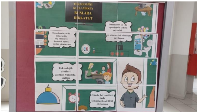
School bulletin boards